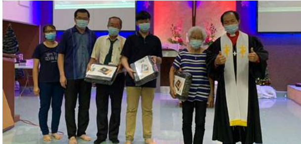
一年内读完旧约或新约圣经者

为了鼓励弟兄姐妹多阅读圣经，2020年基督教教育推动了一系列的活动以让弟兄姐妹参与。其中的活动有：2人一组在半年内读完四福音书、以稿纸抄写《哥林多后书》、一年内读完旧约或新约以及一年内读完整本圣经。