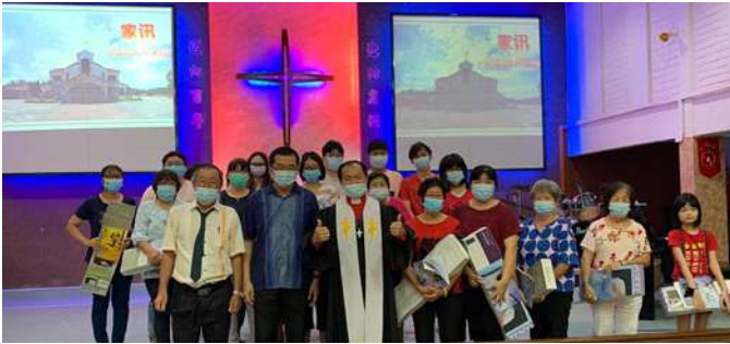
抄写书卷《哥林多后书》