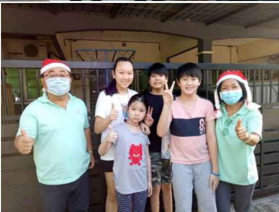
社区报佳音-讲基督的爱传播开来