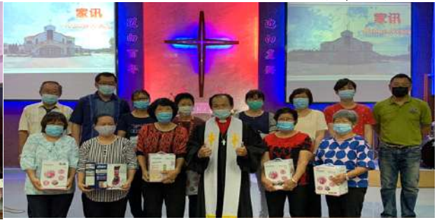
一年内读完整本圣经者

为了鼓励弟兄姐妹多阅读圣经，2020年基督教教育推动了一系列的活动以让弟兄姐妹参与。其中的活动有：2人一组在半年内读完四福音书、以稿纸抄写《哥林多后书》、一年内读完旧约或新约以及一年内读完整本圣经。