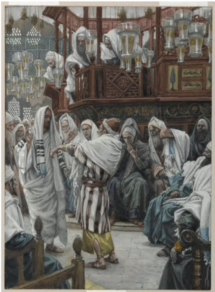
《在会堂治好枯干一只手的人》(The Healing of the Man with the Withered Hand)，收藏地点：布鲁克林博物馆 (Brooklyn Museum)，美国纽约。

詹姆斯·季默 (James Tissot)，法国著名画家，1836年出生于南特。他早年以时尚肖像画和巴黎社交生活的描绘著称，后因信仰经历的转变，将艺术创作转向圣经题材。