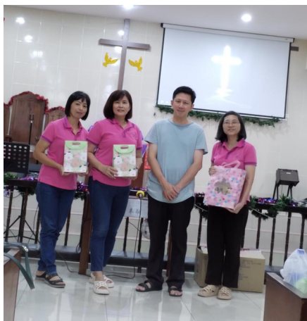
牧师与获颁纪念品的姐妹合影

趁着今日，会长邀请牧师颁发纪念品以鼓励在第49届年会妇女代表大会中参与诗篇默写和圣经测验的三位姐妹。接着，每位出席者都分获一份生日礼物，庆祝从正月至十二月生日的姐妹们。大家合影后，就移步到赞美亭唱生日歌和切蛋糕庆生。姐妹们还准备一些食物和饮料来与会众分享，众人一边品尝美食一边交流情谊，为今日的活动画下圆满的句点。