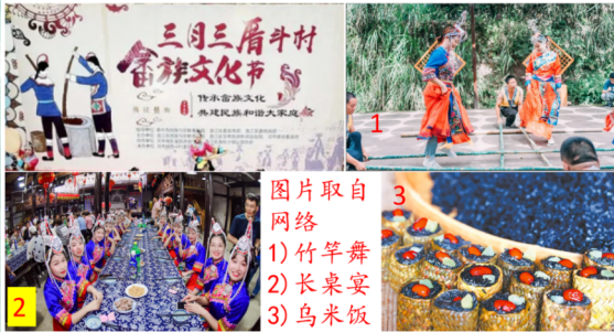
1) 竹竿舞 2) 长桌宴 3) 乌米饭

今天我们吃的菜肴，可能是大马或各国混杂的菜肴，不再是单一籍贯或单一民族的菜肴。这是文化交融的结果，是自然形成的，不是刻意强求的。