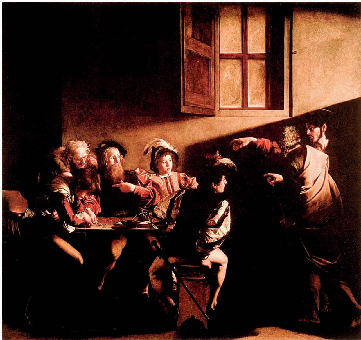
《基督召唤使徒马太》- the calling of st matthew 1599-1600 布面油画 322cm x 340cm 罗马路易吉·德佛朗西斯教堂藏米开朗基罗·梅里西·德·卡拉瓦乔 (Michelangelo Merisi da Caravaggio, 1571-1610)