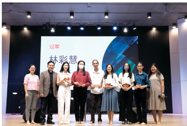
个人赛得奖者全体照

在主的带领下，圣经笔试比赛的圆满落幕，但清福堂的弟兄姐妹们将继续在信仰的道路上共同前行，互相扶持，成为主内美好的见证。在主的爱中不断前进。