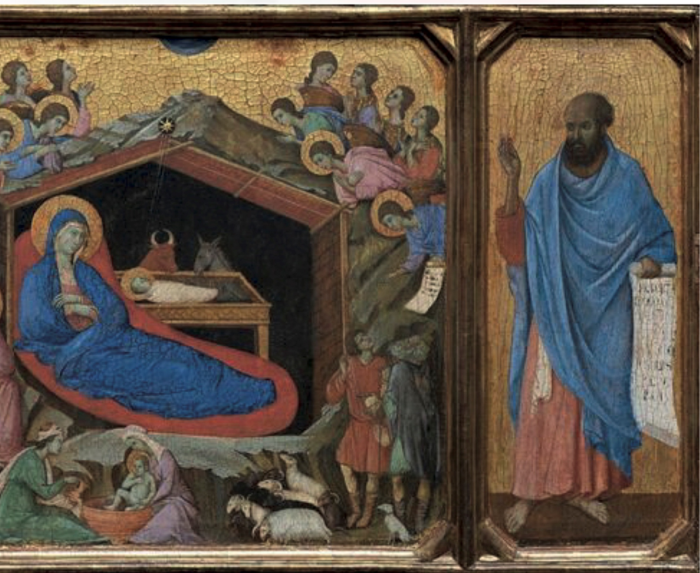
《先知以赛亚和以西结之间的诞生》

彼得·保罗·鲁本斯（Peter Paul Rubens，1577年6月28日 - 1640年5月30日），佛兰德画家，巴洛克画派早期的代表人物。画风有浓厚的巴洛克风格，强调运动、颜色和感官。鲁本斯以其反宗教改革的祭坛画、肖像画、风景画以及有关神话及寓言的历史画闻名。《牧羊人的崇拜》（The Adoration of the Shepherds），布面油彩画，300 x 192厘米，绘于1608年，现藏