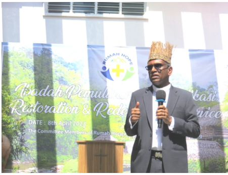
卫理公会总议会会督 贾也古马牧师献辞

教育可改变人的命运，相信儿童之家的原住民孩童在接受教育后，将来也有机会接受大专教育，成为专业人士，为族群，社会、国家作出贡献。感谢华人年议会及曼绒教区的牧者、会友领袖及会友同心协力，促成了原住民儿童之家计划的落实。希望儿童希望之家同人积极发展该中心，让更多有需要的原住民儿童受惠。至于基金方面不是大问题，因为除了人民代议士可协助，还有广大的会友也将会给予大力支持。