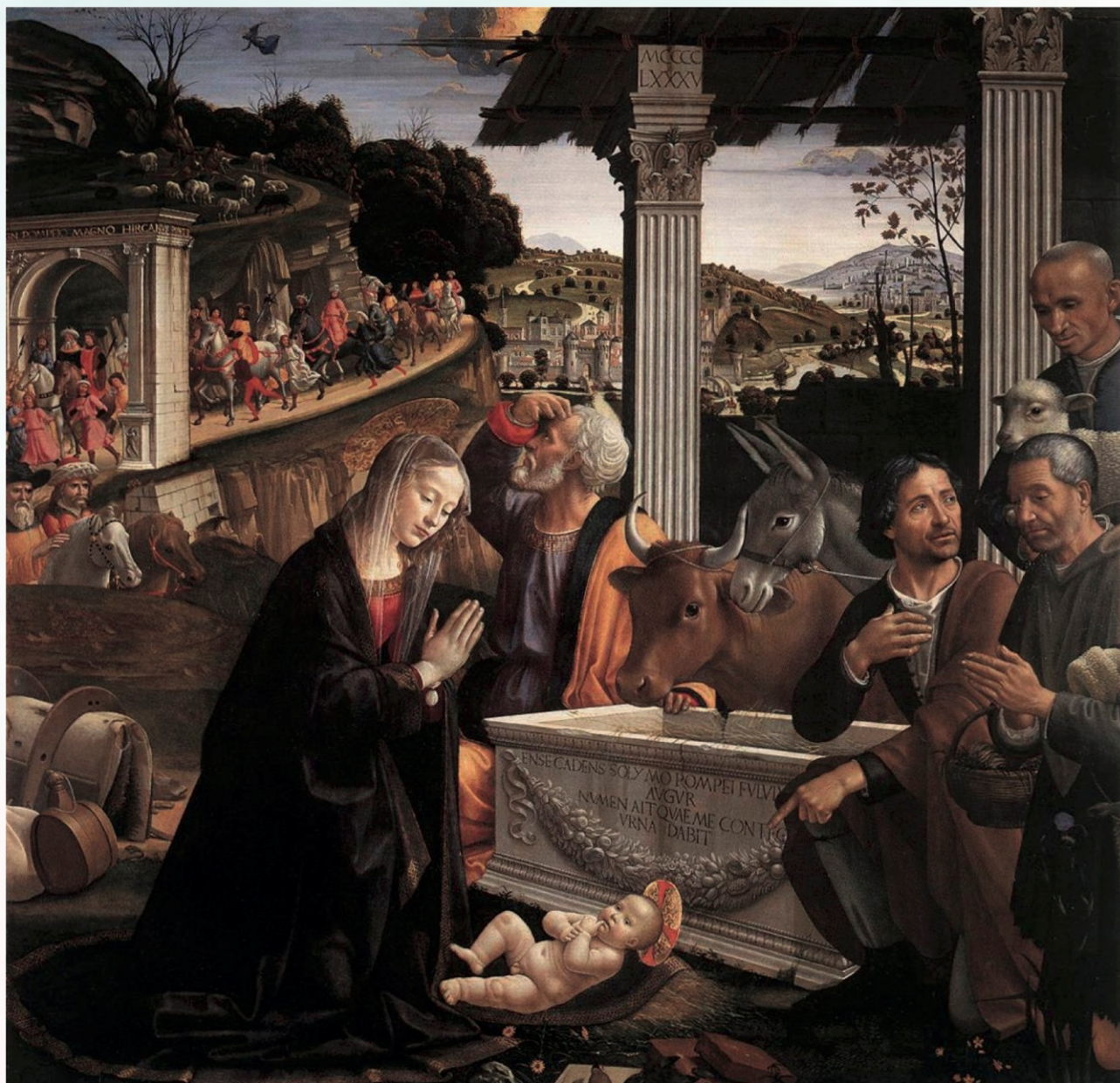
《牧羊人的誕生和崇拜》